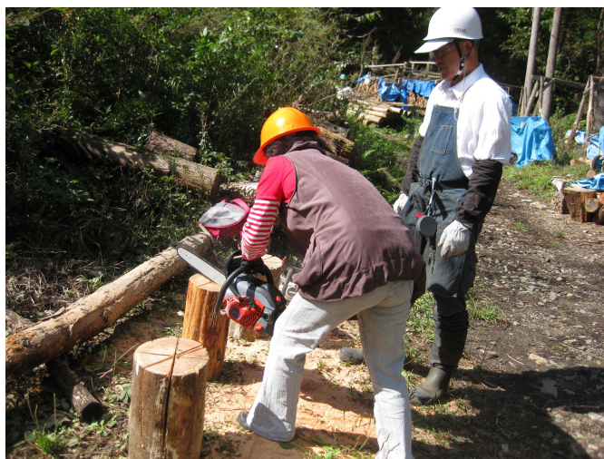
チェーンソーで薪コンロを制作している様子

ピンク色で香り高い「くろもじ」のハーブティーや川崎産の和菓子とお抹茶をいただき、また、チェーンソーの使い方を学んで、薪コンロを実際に作ってみました。各自作った薪コンロはお土産に持ち帰っていただき芋煮会などで使ってもらうことにしました。参加者の中には女性や女子高生もチェーンソーを使い、薪コンロを作っていました。また、チェーンソーの使い方や手入れの仕方についての講習も行いました。会員の為には安全な伐倒の仕方についての講習も行いました。