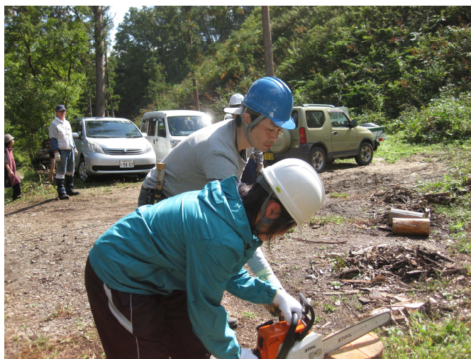
親子で一緒にチェーンソーで薪コンロ作り