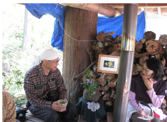
手作りの小屋でお茶を楽しんでいます

なお、来年の2月には体験林業安全講習会も予定しています。ご参加のほどよろしくお願ひいたします。