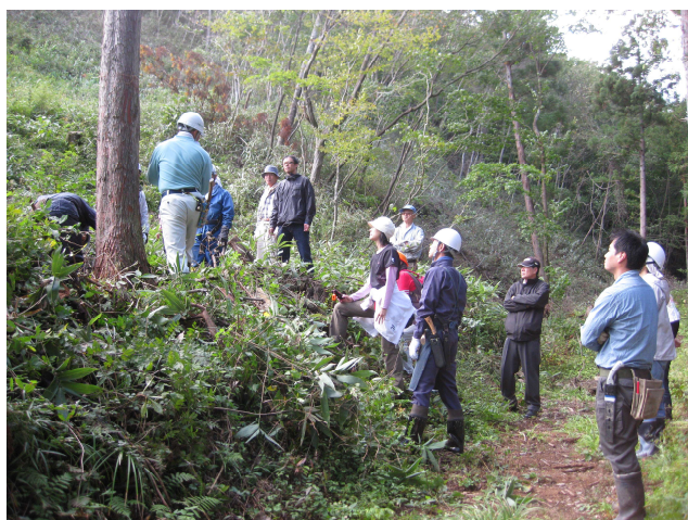
伐倒の前に指導を受けている参加者