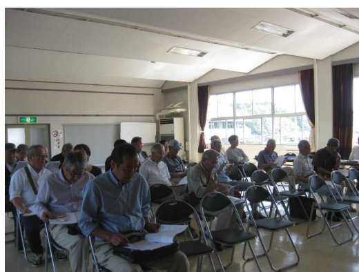
昨年5月21日に開催された通常総会の様子