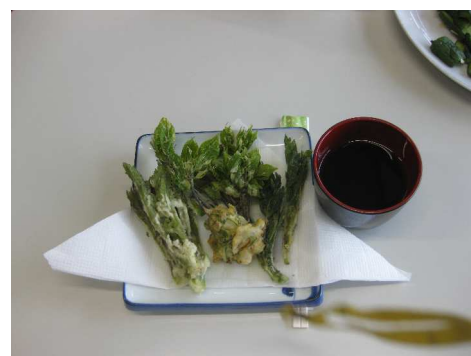
昨年の「春を食う会」の様子

総会の出欠を返信するハガキに、「春を食う会」の申し込み欄がありますので、必ず事前申し込みください。当日は申し込みされた方のみ総会受け付けで会費をお支払いください。